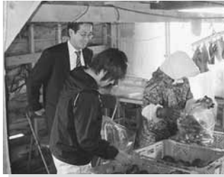
10/27 渡島西部 4 町支援者訪問