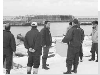
12/21 松前漁協現地調査