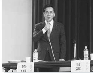
11/11 地域福祉研修会 (鹿部町)