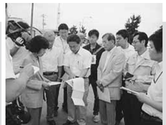
高橋知事と被災漁業施設の復旧調査