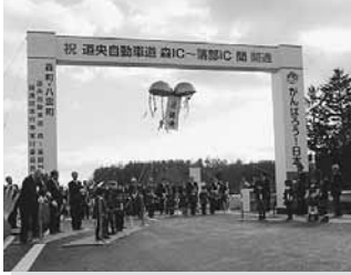
11/26 道央自動車道森～落部間開通