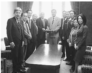
北海道新幹線札幌延伸中央要望