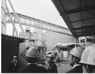
12/14 水産林務委員会道外調査 (岡山県バイオマスタウンと香川県養殖施設)