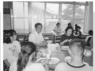
サマースクール in ななえ

輝かしい新年をお迎えのことと、心よりお喜び申し上げます。 さて、昨年は多くの皆様のご支援で、北海道議会議員として政治活動に取り組む機会を頂き、ありがとうございました。私は、皆さんからお寄せいただいたご支援にお応えするため、一所懸命活動をしてきました。しかし、長引く景気低迷で、北海道とりわけ渡島管内は依然として厳しい状況です。三月十一日に発生した東日本大震災による漁業被害や原発事故の影響からその厳しさが頂点に達しました。さらに、政府が T P P 参加に向けた交渉に入るなど、新たな対策も早急に行わなければなりません。その中で、年末には北海道新幹線札幌延伸が大きく前進するなど、うれしいニュースも飛び込んできました。今年こそ、北海道・渡島、皆さまにとってより良い一年となりますようご祈念申し上げ、変わらぬご支援をお願いし、年頭にあたったご挨拶とさせていただきます。