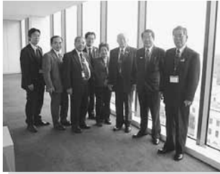
11/10 北海道新幹線札幌延伸中央要望