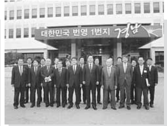
11/16 韓国訪問北海道代表团