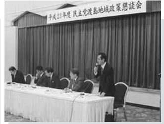
11/ 4 地域政策懇談会