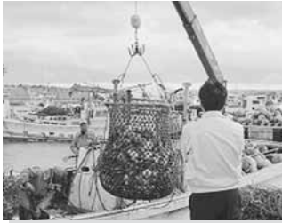
11/ 7 管内調査 (知内町)