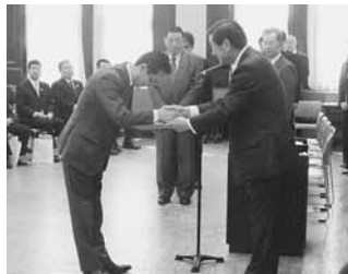
道庁にて当選証書の授与