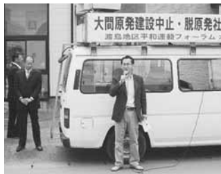
大間原発中止・脱原発街頭宣伝行動