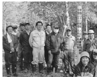
河畔林造成の森 植樹祭