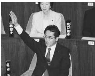
第 2 回定例会にて一般質問に登壇