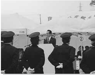
10/22 八雲町消防庁舎落成式

ささだ浩のウェブサイトに掲載されたブログから掲載しています。 詳細はこちらにて→ http://sasada-hiroshi.com