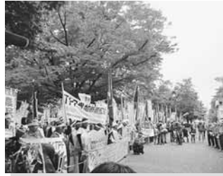
10/26 TPP 交渉参加反対集会