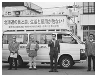
T P P 反対集会と枝野経産大臣へ慎重な対応を要請する中央行動