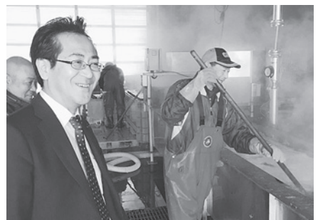
4月25日 地域調査 (木古内町)