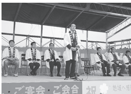
5月3日 もりまち桜まつり