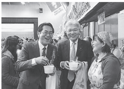
2月21日 カキVSニラまつり (知内町)