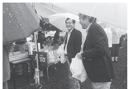
7月2日 長万部毛ガニまつり