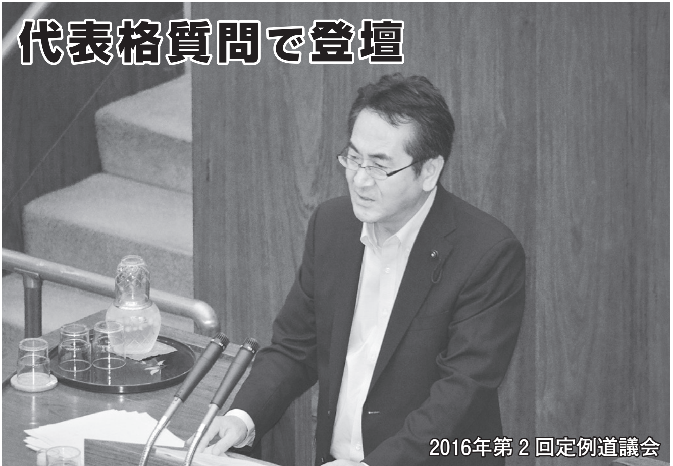
2016年第2回定例道議会