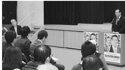
11月17日 七飯町道政報告会