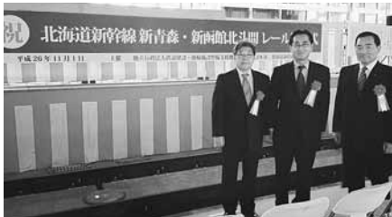
11月1日 道新幹線レール締結式