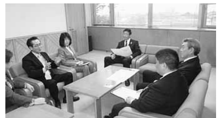
10月6～8日 教育課題調査(渡島管内)