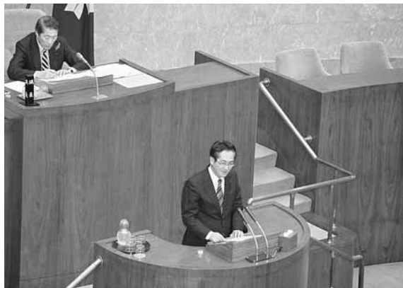
一般質問登壇の様子

（再質問） 認知症かかりつけ医研修を修了した者を活用されるよう、国に要件の緩和を引き続き要望していくという答弁には一定程度理解する