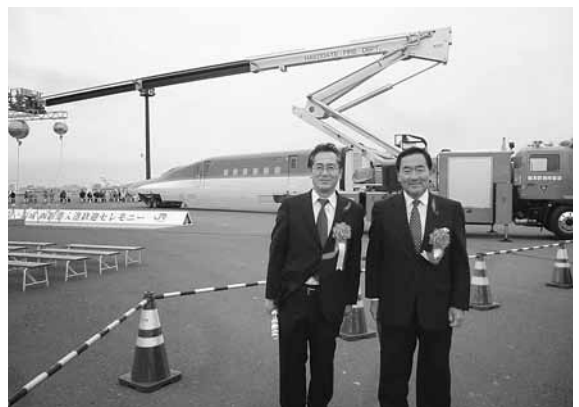
10月13日 北海道新幹線函館港入港

（観光振興監答弁） 道においては、新幹線開業という注目度の高い時期にDCの実施を目指したが、JR北海道の安全運行体制の確立が喫緊の