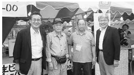
8月20日 しかべ海といで湯のまつり