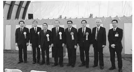
12月13日 立岩トンネル安全祈願祭