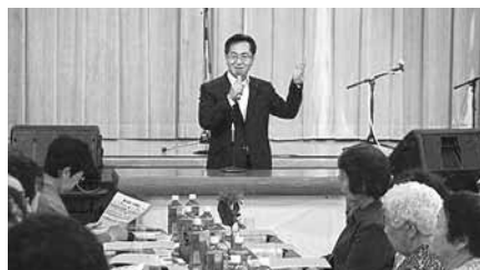
9月13日 熊石地域敬老会