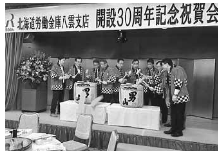
11月18日 ろうきん八雲支店開設30周年