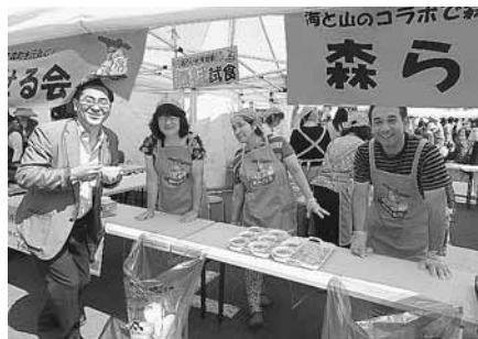
8月20日 森町三業まつり