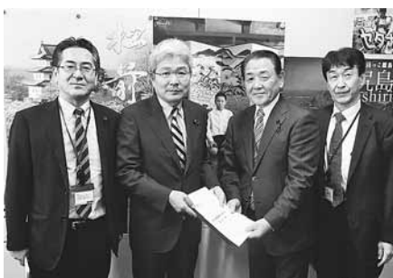
12月6日 農政委員会中央要請