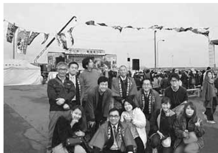
10月22日 やくも大漁秋味まつり