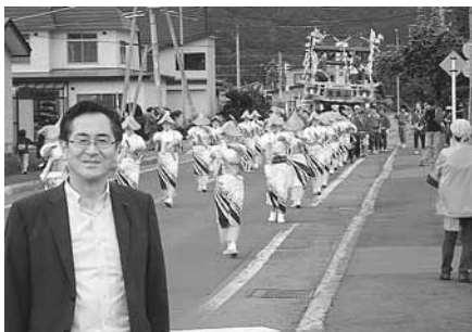
9月17日 福島大神宮祭