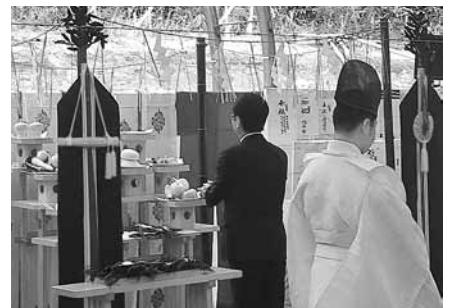
9月1日 新幹線渡島トンネル