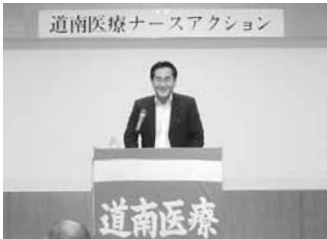
9.8 道南医療ナースアクション