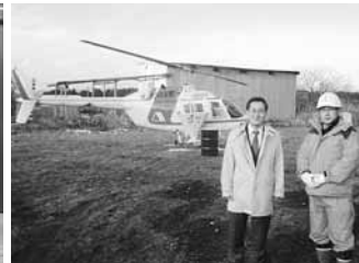
11.22 殺鼠剤空中散布事業視察