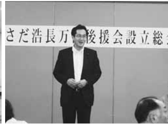
8.26 長万部後援会設立総会