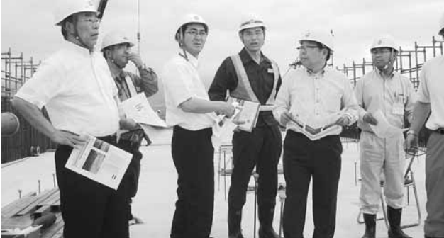
北海道新幹線 橋梁建設現場を視察