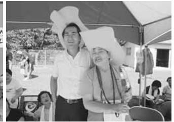
9.2 八雲町熊石地域町民運動会