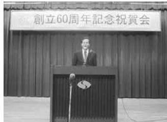
11.17 知内高校創立60周年記念式典