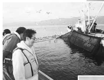
↑南かやべ漁協 大型定置網漁