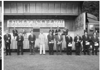
10.7 北斗ふれあい広場2012 in 美ヶ丘