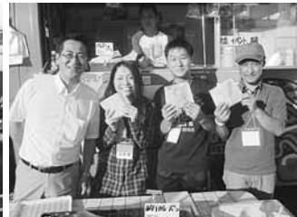
9.23 函館グルメサカス