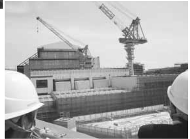
建設中の大間原子力発電所

7月9日から11日の3日間、道議会民主党会派内で組織する北海道政策研究会のメンバーにより、函館市、北斗市、(青森県大間町も含めて)道南の抱える課題などについて調査しました。北海道新幹線の工事現場では、平成27年の開業をめざし急ピッチで工事が進められています。また、青森県大間原子力発電所を視察するためフェリーにて大間に向かいました。残念ながら現在工事が再開されていますが、工事凍結に向け取り組まなければなりません。さらに、エネルギーのあり方や再生可能エネルギーの普及などについてしっかり議論していかなければなりません。