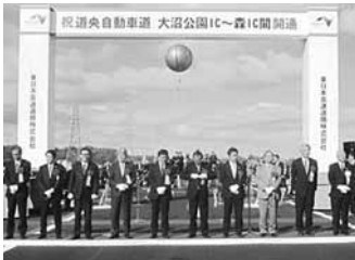
11.10 道央自動車道大沼公園IC開通