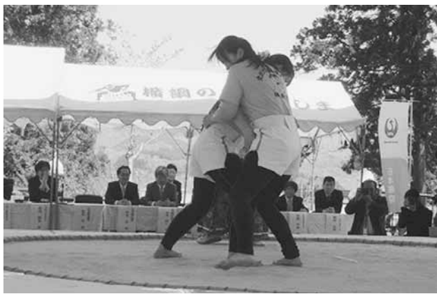
→ 5月23日 福島町「女だけの相撲大会」