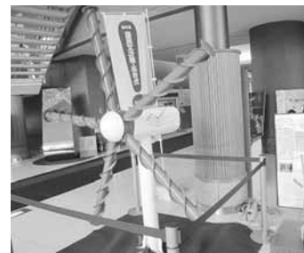
秋田県庁ロビーに展示されている「スパイラルマグナス風車」