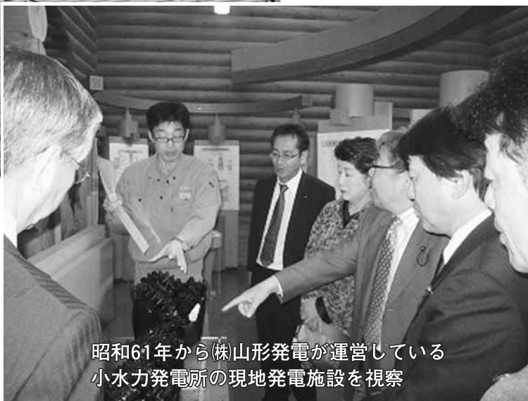
昭和61年から(株)山形発電が運営している小水力発電所の現地発電施設を視察

5月9日から11日にかけて秋田・山形の新エネルギー政策などの視察を実施しました。