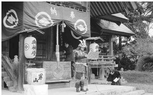
← 4月29日「松前さくらまつり」