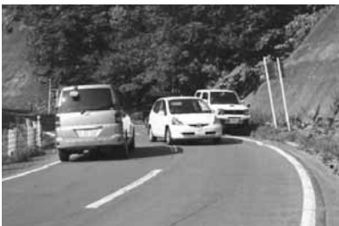
道路幅員が狭く、大型車両の相互通行が困難。