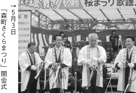
→ 5月3日 「森町さくらまつり」開会式