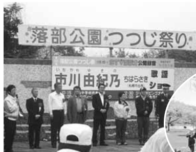
← 6月3日 八雲町 「落部公園つつじ祭り」