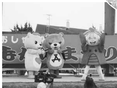
↑ 5月27日 長万部町 「町民花見会」 大人気のまんげくんが会場を盛り上げていました。 7月1日 ←「長万部毛がにまつり」