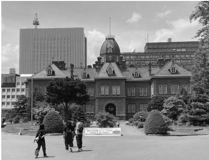
7月25日にリニューアルオープンした赤れんが庁舎